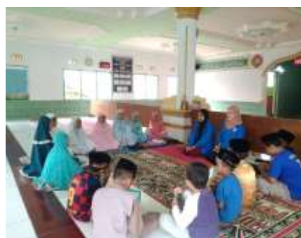
Gambar 2 Menceritakan Kisah Nabi