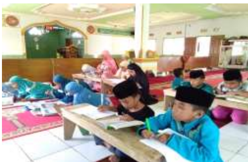
Gambar 1 Pelatihan Menulis Huruf Hijaiyah

Pada tahap ini penulis mengevaluasi kemampuan atau pemahaman santri selama proses pelatihan baca tulis al-Qur'an. Hal ini dilakukan untuk mengetahui sejauh mana kemampuan dan perhatian santri terhadap apa yang telah diajarkan, selama dilakukannya pelatihan baca tulis al-Qur'an.