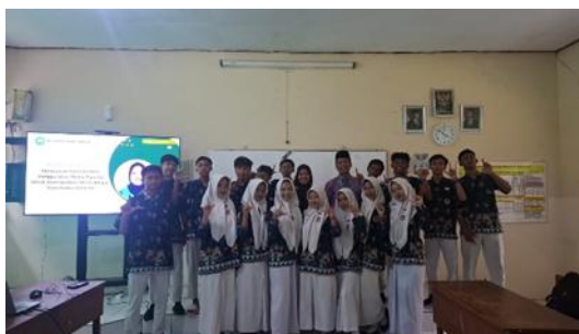
Gambar 7. Apresiasi dari Kepala Madrasah

Penulis menyampaikan ucapan terima kasih dan penghargaan setinggi-tingginya kepada Kepala Madrasah MAN 2 Lamongan beserta jajaran Dewan Guru atas izin dan fasilitasi yang diberikan. Apresiasi khusus ditujukan kepada siswa kelas XII-5 yang telah berpartisipasi dengan antusiasme tinggi. Penulis juga berterima kasih kepada Universitas Islam Malang atas dukungan pendanaan dan sarana yang memungkinkan terlaksananya kegiatan pengabdian kepada masyarakat ini dengan lancar dan sukses.