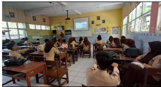
Gambar 3. Orientasi dan Pelatihan

Tahap Orientasi dan Pelatihan difokuskan pada penguasaan alat ( tool mastery ). Instruktur memperkenalkan antarmuka FlipaClip, fungsi layer untuk memisahkan objek bergerak dan latar belakang, pengaturan frame rate (FPS) untuk kehalusan animasi, serta teknik perekaman suara ( dubbing ). Materi matematika yang disepakati untuk divisualisasikan meliputi Statistika, Lingkaran, Aljabar, Kaidah Pencacahan (Permutasi dan Kombinasi), dan Peluang Kejadian.