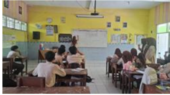
Gambar 1. Pra Kegiatan