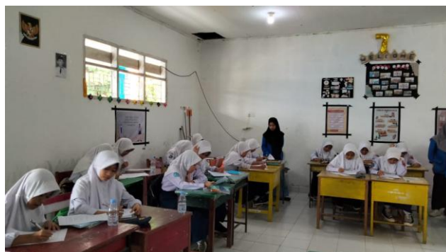
Gambar 2. Pengisian angket

Pada tahap berikutnya dilakukan dengan pemberian angket kepada peserta didik berupa angket diagnostik awal yang memuat beberapa pertanyaan mengenai hal-hal diluar aspek kognitif peserta didik seperti dibawah ini.