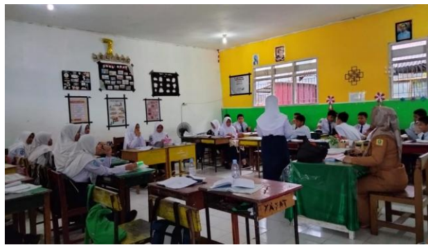
Gambar 1. Proses pembelajaran

Pada tahap awal kegiatan pengabdian, peneliti melakukan pengamatan mengenai pola interaksi antara peserta didik dengan pendidik maupun peserta didik dengan sesamanya. Kegiatan pengamatan ini berjalan dengan lancar dan dapat dikatakan bahwa kegiatan pembelajaran berlangsung dengan baik, terdapat interaksi yang baik antara pendidik dengan peserta didiknya. Peserta didik terlihat antusias selama mengikuti kegiatan pembelajaran, aktif bertanya, menjawab dan mencatat penjelasan gurunya. Proses pembelajaran juga seringkali diiringi dengan canda tawa oleh guru dan peserta didiknya.