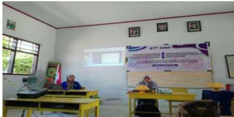
Gambar 2. Pemaparan Materi Media Pembelajaran Canva

Selanjutnya tahap pelaksanaan pelatihan yaitu pemateri pelatihan memperkenalkan aplikasi Canva sebagai media pembelajaran dengan presentasi dihadapan peserta, dan prosedur menggunakan Canva Education .