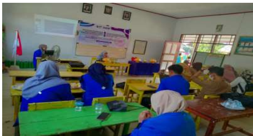
Gambar 4. Pendampingan dan Praktek Penggunaan Aplikasi Canva

Para peserta pelatihan berantusias, hal ini terlihat saat peserta mengajukan pertanyaan mengenai penggunaan aplikasi.