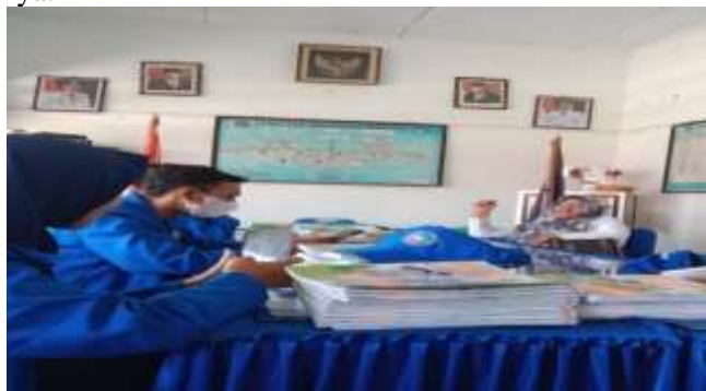
Gambar 1. Tahap Observasi Lokasi

Tahap persiapan, observasi lokasi dan wawancara langsung dengan guru di SD 256 Malimongeng telah dilakukan jauh hari sebelum kegiatan dilaksanakan. Informasi yang didapatkan bahwa, beberapa guru sudah memiliki akun Canva , tapi belum mahir dalam mengaplikasikannya.