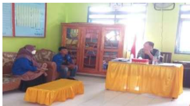
Gambar 1 Persiapan Kegiatan

Persiapan pertama untuk kegiatan pengabdian ini adalah survey atau observasi awal. Hal ini dilakukan untuk melihat kondisi dan kemungkinan yang bisa dilacak. Untuk meningkatkan kemampuan bahasa Inggris anak-anak di desa Padaelo. Setelah berkoordinasi dengan pemerintah daerah dan guru sekolah, tim pengabdian akan dalam hal ini, peserta KKNP akan memberikan kursus bahasa Inggris gratis kepada anak-anak yang bertajuk english meeting club for young learner di Desa Padaelo.