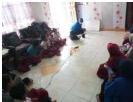
Gambar 2 Pelaksanaan Kegiatan EMC di Posko KKNP Desa Padaelo

Dalam kegiatan ini peserta didik mendapatkan pelajaran berupa materi dasar bahasa Inggris seperti Alphabet, Number, Animals, Fruits, Color, Days, dan Introducing My Self .