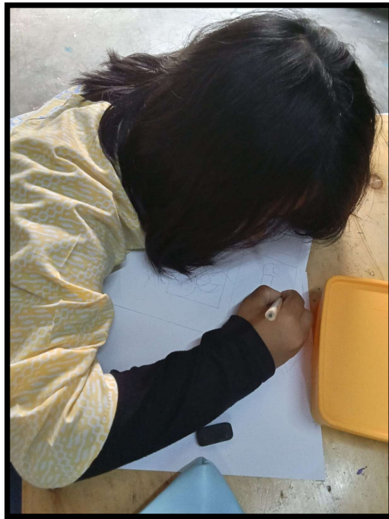
(Siswa penyandang DS sedang mengerjakan soal melengkapi gambar)