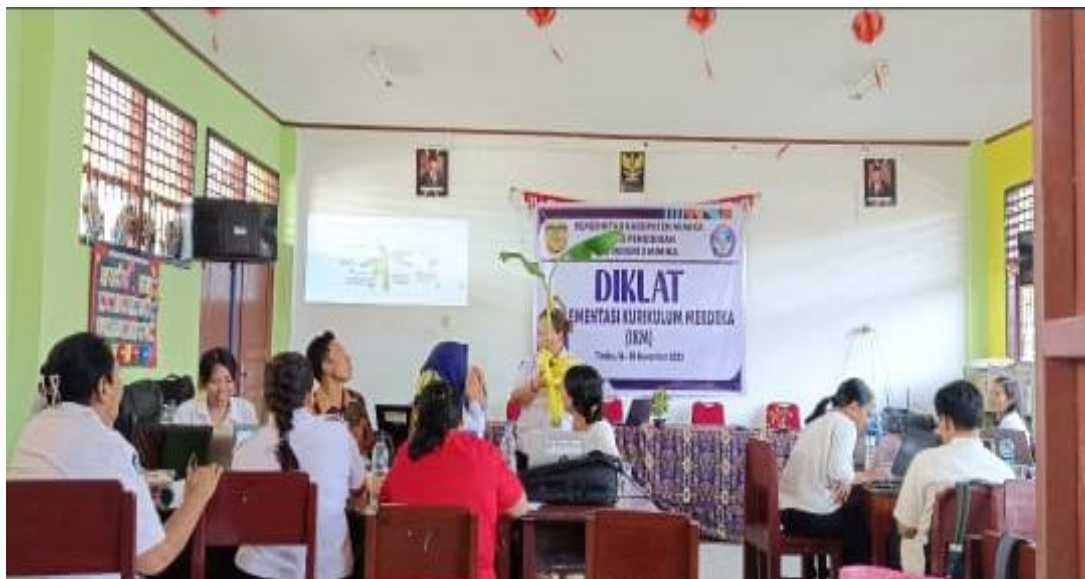
Gambar 4. Presentasi setiap Kelompok

Pada gambar 3 ini, setelah pembagian kelompok selesai, langkah berikutnya adalah praktik pembuatan modul proyek. Dalam tahap ini, setiap kelompok diberikan panduan dan bimbingan untuk merancang modul proyek yang mencakup materi tentang nilai-nilai Pancasila. Mereka diajak untuk berdiskusi, melakukan riset, dan menyusun materi pembelajaran yang relevan, menarik, dan mudah dipahami oleh target audiens. Kemudian, setelah modul proyek selesai dirancang, empat kelompok tersebut mempresentasikan hasil kerja mereka secara bergantian di hadapan peserta lainnya dan pengajar.