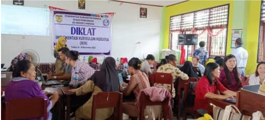
Gambar 1. Persiapan dan pengarahan

mengenal satu sama lain, dan siap untuk memulai proses pembelajaran yang intensif mengenai penyusunan proyek P5.