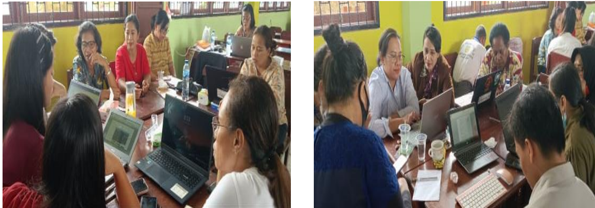
Gambar 3. Proses Diskusi

Pada gambar 2 ini, para peserta mengatur kursi dan mulai mencari kelompok masing-masing dengan jumlah 7 orang, dengan berdasarkan rumpun mata pelajaran yang sama. Sehingga mereka dapat menyatukan pendapat mereka terkait penyusunan modul proyek penguatan profil pelajar Pancasila.