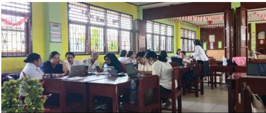
Gambar 2. Pembentukan Kelompok

Pertama-tama, setelah memperoleh pemahaman yang cukup tentang tujuan dan metode proyek P5, para peserta didik dibagi menjadi empat kelompok yang seimbang berdasarkan minat dan kemampuan mereka dalam memahami serta menerapkan nilai-nilai Pancasila. Pembagian kelompok ini bertujuan untuk memfasilitasi kolaborasi dan dukungan antaranggota kelompok.