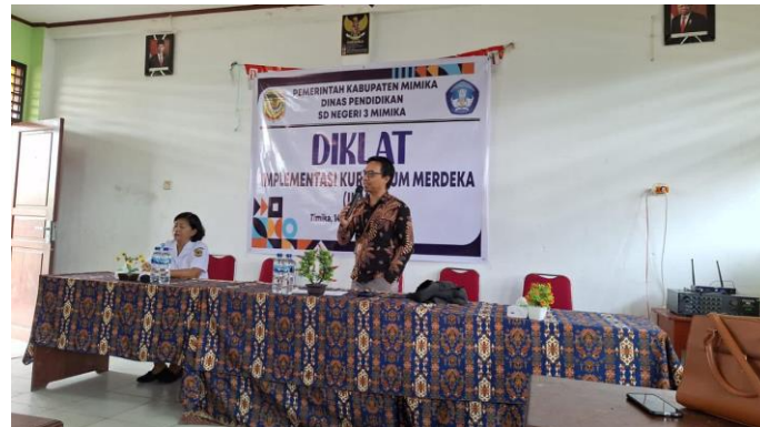
Gambar 1. Penyampaian Materi dari Pemateri/pendamping

Melalui pendekatan Participatory Action Research (PAR), guru bertindak sebagai fasilitator dalam mengimplementasikan pembelajaran berdiferensiasi. Partisipasi guru menciptakan lingkungan belajar yang interaktif dan responsif. Partisipasi guru sebagai fasilitator menciptakan atmosfer belajar yang dinamis.