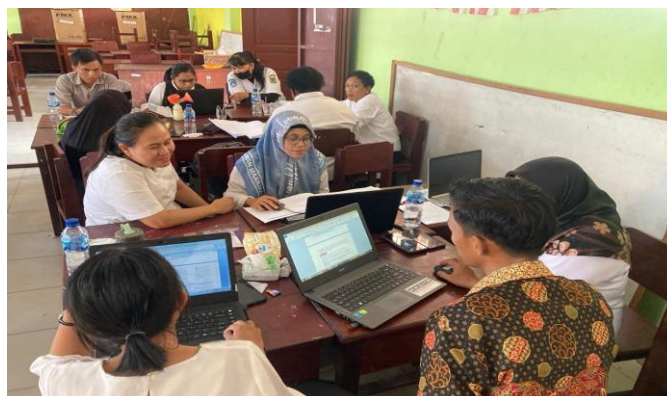
Gambar 3. Partisipasi guru mengerjakan Lembar Kerja (LK)

Partisipasi guru dalam DIKLAT mencerminkan tingkat keterlibatan yang sangat baik. Kehadiran yang konsisten dan peran aktif sebagai menyelesaikan dan berkolaborasi dalam penerimaan materi dan penyelesaian tugas kelompok.