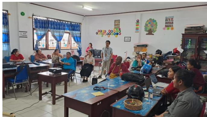
Gambar 4. Kegiatan Refleksi Dan Perbaikan

Refleksi bersama dilakukan dengan melibatkan kepala sekolah, guru dan pemateri/pendamping. Pemateri/pendamping menampilkan hasil observasi yang telah dilakukan. Identifikasi kelebihan dan kelemahan dalam praktek pembelajaran dilakukan untuk perbaikan yang dituangkan dalam bentuk Rencana Tindak Lanjut (RTL).