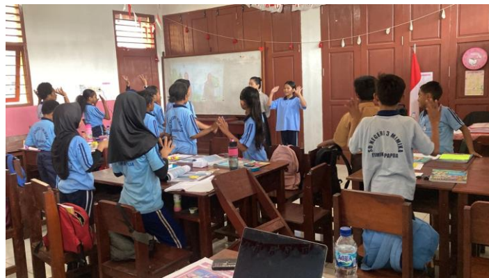
Gambar 2. Praktek Pembelajaran Berdiferensiasi yang dilakukan oleh salah satu guru

Partisipasi guru dalam pemantauan memungkinkan pengumpulan data yang komprehensif, menciptakan pemahaman mendalam tentang pelaksanaan program, dan mengidentifikasi perubahan yang diperlukan.