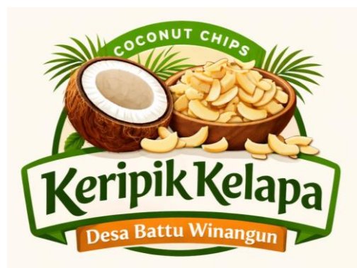
Gambar 1. Desain logo untuk produk keripik kelapa

Sebagai sebuah kelompok, kami berhasil mendesain logo untuk UMKM Keripik Kelapa yang kami harapkan dapat menarik perhatian konsumen dan menghasilkan penjualan yang tinggi. Menurut Kusrianto (2009), logo yang juga dikenal sebagai tanda gambar atau simbol visual, merupakan identitas yang dirancang untuk mewakili karakter, nilai, dan citra suatu organisasi, perusahaan, atau lembaga. Logo berfungsi sebagai alat komunikasi visual yang memungkinkan masyarakat atau publik mengenali dan membedakan suatu entitas dari entitas lainnya. Dengan kata lain, logo tidak hanya sekedar gambar, tetapi juga mencerminkan kepribadian, tujuan, dan reputasi organisasi yang diwakilinya (Satriadi, 2024). Logo seperti ini dirancang khusus untuk label produk ini. Logo ini memiliki banyak potensi untuk berkembang dan menjadi ciri khas produk berkat upaya kami.