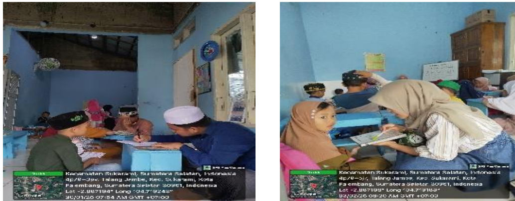
Gambar 2. Bimbingan Santri Pembacaan Iqra' dan Al-Qur'an

sudah mulai membaca mushaf Al-Qur'an. Bimbingan dilakukan secara individual dan kelompok kecil agar lebih fokus. Pembacaan dilakukan secara talaqqi (santri membaca di depan pembimbing) dan dikoreksi langsung. Mahasiswa juga menerapkan pembelajaran berbasis reward (seperti bintang prestasi dan pujian) untuk meningkatkan semangat belajar santri. Program ini terbukti meningkatkan kelancaran dan ketepatan bacaan, terutama dalam pengucapan huruf dan tanda baca.