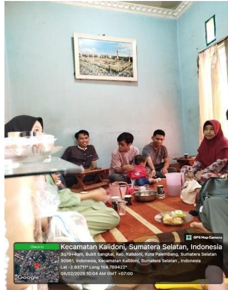
Gambar 5. Rapat Evaluasi para Ustadz dan Ustadzah

mengajar dan membimbing, agar lebih efektif dan sesuai dengan kebutuhan santri. Selain itu, adanya refleksi berkala juga memperkuat koordinasi antara mahasiswa dan pihak rumah tahfidz.