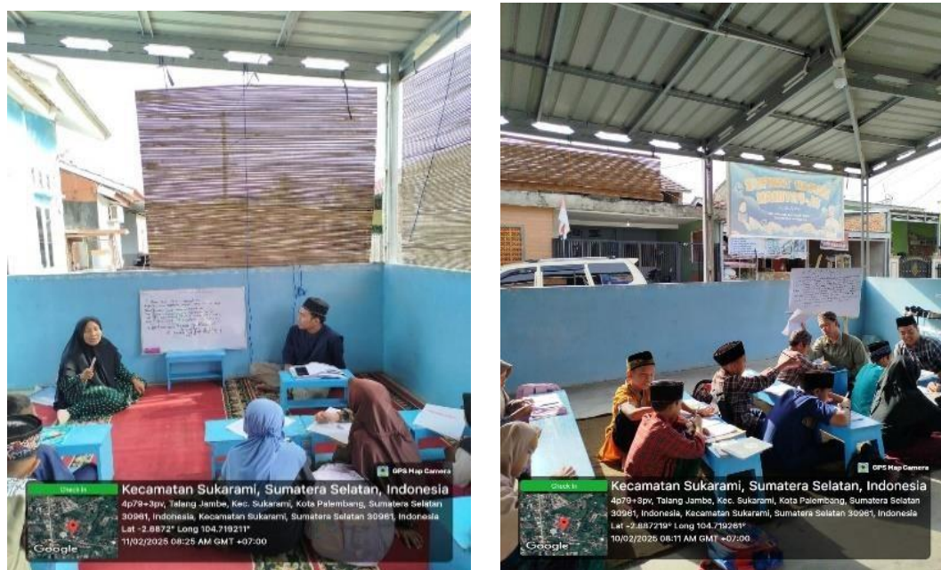
Gambar 4. Pemberian Materi Keislaman

Salah satu metode yang digunakan adalah pembelajaran berbasis cerita (kisah teladan) . Mahasiswa menyampaikan kisah-kisah Nabi, sahabat, dan tokoh-tokoh Islam dengan cara yang menarik, seperti mendongeng, teatrikal sederhana, dan diskusi ringan. Tujuannya adalah agar santri tidak hanya mengenal tokoh Islam, tetapi juga meneladani akhlaknya. Dalam pelajaran akidah dan ibadah, mahasiswa mengenalkan rukun iman, rukun Islam, tata cara wudhu, shalat, dan doa harian melalui praktik langsung dan permainan edukatif. Hal ini sejalan dengan pandangan bahwa pelaksanaan KKN dapat menjadi sarana pembentukan karakter dan profesionalisme calon pendidik serta pemimpin masa depan.