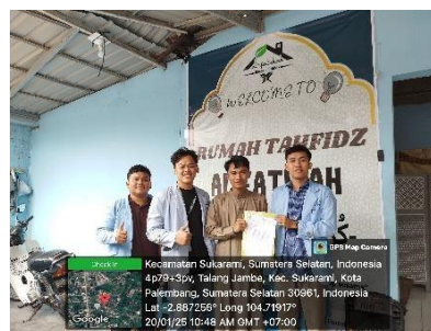
Gambar 1. Survey Lokasi dan Pemberian Surat Izin