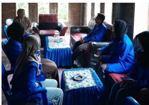
Gambar 1. Melakukan observasi/kunjungan ke rumah pembinaTK/TPA

Tujuan diadakannya observasi ini, adalah untuk mengetahui dan menemukan tempat-tempat yang ingin dibuktikan untuk melaksanakan kegiatan pembinaan ini. Hasil observasi awal yang penulis dapatkan adalah terdapat beberapa santri yang terkadang malas untuk ikut belajar, dan masih banyak juga yang belum mampu membaca Al-Qur'an dengan baik dan benar dengan menggunakan metode qiraati, oleh karena itu perlu diadakan pembinaan dan pendampingan terhadap santri untuk lebih mahir membaca Al-Qur'an serta menghafalkannya.