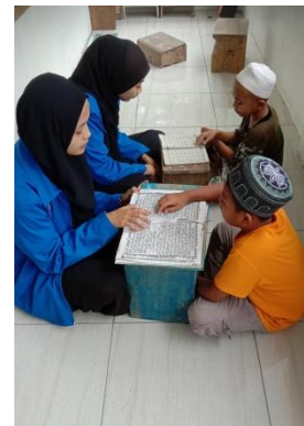
Gambar 2. Proses pelaksanaan pembinaan

Setelah melakukan pembinaan maka tentunya ada evaluasi yang diberikan kepada para santri untuk dapat mengetahui dan menilai sejauh mana kemampuan para santri yang di dapatkan selama dilakukannya pembinaan. Tujuan diadakannya evaluasi ini adalah untuk melihat kemampuan para santri dalam membaca Al-Qur'an, hafalan surah pendek, dan hafalan doa-doa harian. Kegiatan ini dapat memberikan dampak positif terhadap santri untuk meningkatkan prestasinya dengan memperoleh nilai yang memuaskan.