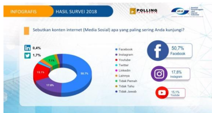
Gambar 2 Hasil Survei 2018-pengguna internet indonesia

Berdasarkan gambar di atas, menunjukkan bahwa penetrasi pengguna internet pada tahun 2018 sebanyak 171,17 juta jiwa dari total populasi penduduk Indonesia 264,16 juta orang. Dimana penggunaan internet sebanyak 64,8% pada tahun 2018. Remaja saat ini lebih memilih berbelanja menggunakan media sosial dengan alasan simple, hanya mengklik kemudian transfer lalu barang akan datang sendiri ke rumah. Salah satu media sosial yang saat ini sangat diminati adalah Instagram. Hal tersebut dapat di lihat pada tahun 2018 Berdasarkan hasil studi Polling Indonesia yang bekerja sama dengan Asosiasi Penyelenggara Jasa Internet Indonesia (APJII) di 2018 yang dapat di lihat pada gambar berikut ini: