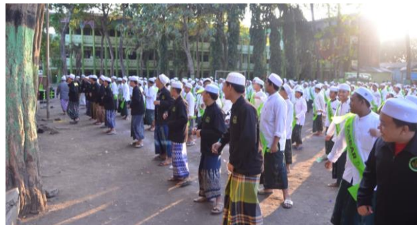
Gambar 3.1 Senam Santri

Selain membantu pengelolaan kegiatan, ITMARIS juga menjalankan berbagai program seperti lomba kebersihan, baca kitab kuning, pidato, dan pertandingan sepak bola antar asrama yang memiliki fungsi edukatif. Kegiatan ini tidak hanya meningkatkan partisipasi santri, tetapi juga mempererat hubungan sosial antarsantri. Kegiatan yang bersifat kolaboratif seperti ini membentuk ekosistem interaksi yang sehat dan menumbuhkan rasa kepemilikan terhadap lingkungan pesantren. Visualisasi kegiatan seperti senam dan jumat bersih yang terdokumentasi dalam foto dan dokumentasi kegiatan menunjukkan keterlibatan aktif para santri dalam kegiatan organisasi (Fajarudin et al., 2024).