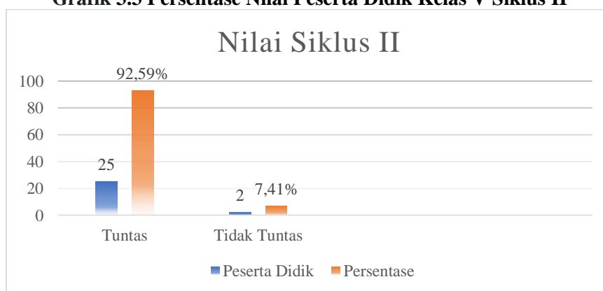
Grafik 3.3 Persentase Nilai Peserta Didik Kelas V Siklus II

Berdasarkan hasil observasi, mutu bacaan Al-Qur'an siswa PAI SDN 56 Salodua mengalami peningkatan. Hanya dua siswa (7,41%) yang belum tuntas pada kategori "Baik Sekali", sedangkan yang tuntas sebanyak 25 siswa (92,59%).