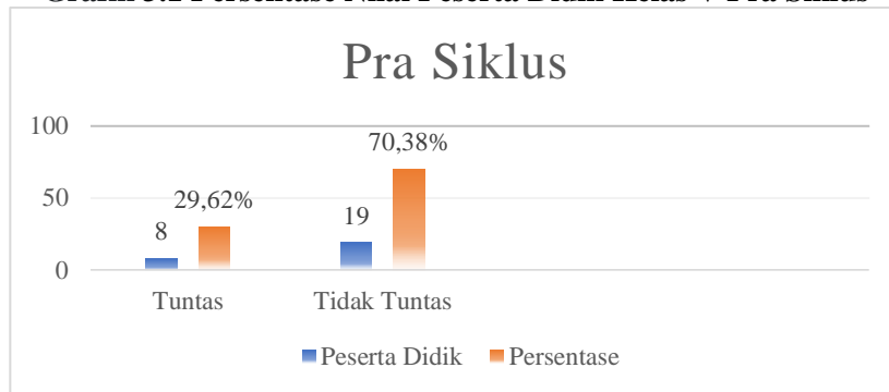
Grafik 3.1 Persentase Nilai Peserta Didik Kelas V Pra Siklus