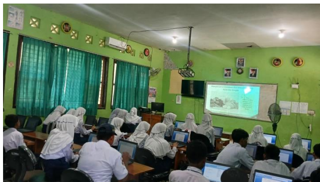
Gambar 3.1 Penggunaan Aplikasi Canva dalam Proses Pembelajaran PAI di SMP Negeri 2

DZM, salah satu siswa SMP Negeri 2 Kendit Situbondo, juga memberikan pandangannya, "Saya merasa lebih mudah memahami materi PAI sejak guru mulai menggunakan Canva. Biasanya, kalau hanya mendengarkan penjelasan dari buku, saya cepat merasa bosan. Tapi dengan Canva, saya bisa melihat gambar-gambar menarik dan warna-warna yang membuat saya lebih fokus. Saya juga senang karena terkadang kami diberi tugas untuk membuat desain sendiri. Misalnya, saya pernah membuat infografis tentang rukun Islam, dan itu membuat saya jadi lebih paham dibandingkan hanya membaca teks saja. Selain itu, saya juga merasa lebih percaya diri saat mempresentasikan hasil kerja saya kepada teman-teman." Data tersebut diperkuat oleh data hasil observasi dan dokumentasi dibawah ini: