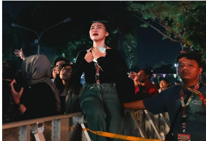
Gambar 3.1. Gambar seorang wanita yang menangis di Synchronize Fest 2024

Penampilan Haddad Alwi di Synchronize Fest 2024 , di Jakarta, pada Ahad, 6 Oktober 2024 itu semakin menjadi sorotan tajam setelah sebuah video viral memperlihatkan seorang perempuan tanpa hijab menangis tersedu-sedu saat sholawat berkumandang. Synchronize Fest , yang semula dikenal sebagai festival musik indie dan modern mendadak bertransformasi menjadi ruang perenungan spiritual di tengah keramaian (Ya, 2024).