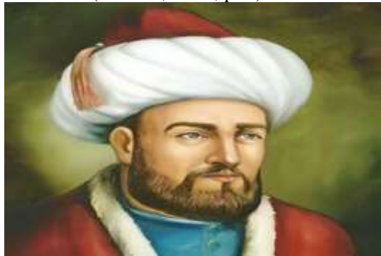
Gambar 1 Imam Al-Ghazali

Dalam sejarah ilmu pengetahuan Islam, Imam Abu Hamid Al-Ghazali (450-505 H/1058-1111 M) hidup pada akhir zaman keemasan, di bawah khilafah Abbasiyah yang berpusat di Baghdad. Dia adalah faqih, mutakallim, filsuf, dan sufi, serta seorang reformator keagamaan dan kemasyarakatan yang memiliki pengaruh dan akar kuat dalam sejarah Islam. Imam Al-Ghazali juga memiliki pengetahuan yang luas dan mendalam (Faridah, 2023, p. 1).