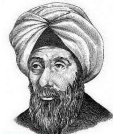
Gambar 2 Ibnu Arabi

Salah satu tokoh tasawuf Ibnu Arabi, yang titik pandangnya sebagian besar adalah filsafat, serta al-Quran dan hadits, sangat populer di kalangan akademisi. Ini mungkin karena perspektifnya yang berbeda dari tasawuf dan masalah agama dan ketuhanan. Ibnu Arabi digambarkan sebagai orang yang mengembangkan Tasawuf Falsafi setelah para sufi sebelumnya membahas konsep tasawuf falsafinya secara bertahap. Dengan kehadiran Ibnu Arabi di dunia literasi, banyak tokoh yang mengikuti jalannya, sementara banyak juga yang mengecam dan menolak gagasannya yang berfokus pada pengalaman spiritual. Diantara beberapa ide Ibnu Arabi yang dibahas dalam Kitab Hakikat al-Ibadah, yang ditulis oleh Karam Amin Abu Bakr, adalah konsep Hulul , Ittihad , Wahdatul Wujud , Insan Kamil , dan filsafat ibadah, yang mencakup shalat, zakat, dan puasa, antara lain (Murtaza et al., 2022, p. 232).