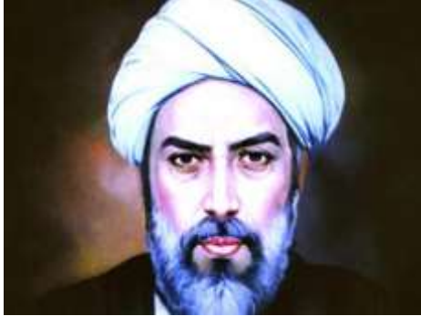
Gambar 3 Mulla Shadra

Mulla Shadra adalah seorang intelektual yang tidak hanya belajar filsafat tetapi juga tasawuf, yang ia praktekkan dengan berzuhud. Pemikiran Mulla Shadra dipengaruhi oleh pemikiran yang beragam dari zaman Kerajaan Safawi, yang memiliki banyak tokoh filsafat dan tasawuf. Mulla Shadra lebih suka tokoh filsafat daripada tasawuf jika ditanya. Mulla Shadra menggunakan pemikiran filsafatnya untuk menjelaskan pengalamannya spiritualnya (Marzuki, 2022, p. 42).