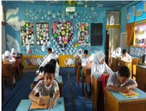
Gambar 5 Siswa mengisi kartu karakter

Berikut kondisi saat siswa mengisi kartu karakter: