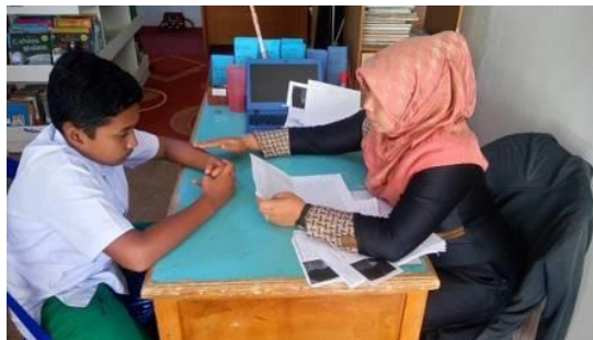
Gambar 2 Pemanggilan Siswa Satu per Satu

Pada suatu kesempatan juga, guru memanggil siswa secara mandiri, satu per satu untuk dilakukan pembinaan. Pembinaan yang dilakukan dimulai dengan diskusi dengan siswa. Dimana, guru membacakan tulisan dari orang tua dan siswa tersebut di hadapan siswa. Disini muncul keterbukaan antara siswa dan orang tua melalui tulisan. Dari hasil diskusi dengan siswa, guru mengundang orang tua datang ke sekolah. Dilakukan pada periode 3 bulan sekali, saat pembagian nilai ujian dan evaluasi pembelajaran siswa di sekolah.