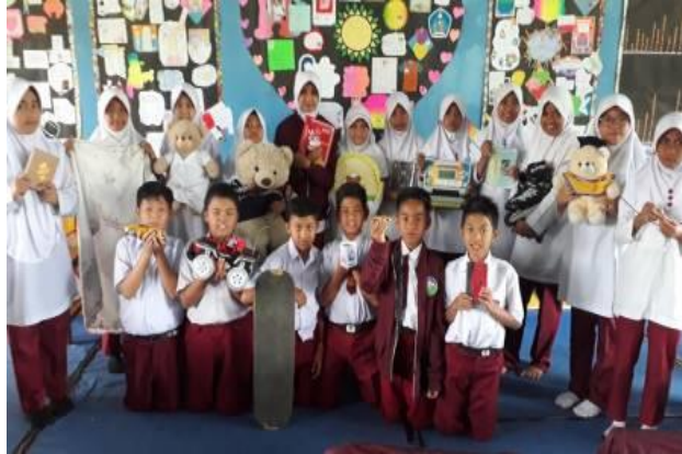
Gambar 6 Pameran benda kesayangan

yang berkebutuhan khusus, sehingga siswa berkebutuhan khusus mendapat reward dari guru berupa bintang prestasi yang membuat mereka sangat senang dan bangga, dan termotivasi untuk bekerja keras.