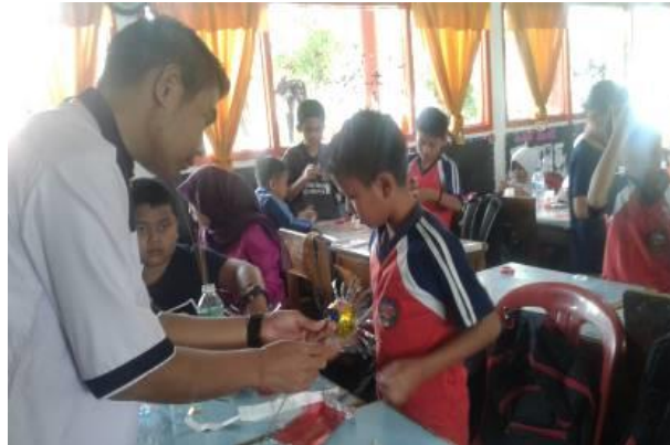
Gambar 7 Membuat Keterampilan dari Barang Bekas