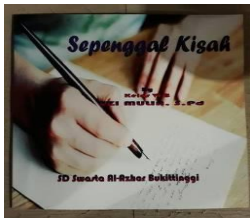
Gambar 3 Kumpulan cerita siswa

Pembuatan sepenggal kisah ini bertujuan untuk mengetahui latar belakang, kondisi siswa baik di rumah, di sekolah dan lingkungannya, yang sebenarnya tidak bisa dipantau secara terus menerus oleh guru. Melalui sepenggal kisah inilah guru bisa mengetahuinya. Dengan adanya cerita ini, maka guru bisa melayani siswa sesuai dengan beragam kondisi dan latar belakang siswa hal ini tentu sejalan dengan yang dimaksud oleh F. Annisa, (2019) bahwa penerapan nilai-nilai karakter pada siswa tidak jauh dari layanan guru yang diberikan kepada siswanya. Siswa dapat menjalin proses pembelajaran tanpa adanya masalah yang belum selesai atau masalah yang mereka pendam, sehingga menerima pelajaran dengan baik. Guru bisa berperan sebagai kakak, orang tua, atau pun teman sehingga siswa lebih leluasa untuk menuliskan ceritanya. Kumpulan sepenggal kisah dari siswa ini dikumpulkan dan dilid dengan baik, sebagai dokumen penting guru. Sepenggal kisah ini akan dihubungkan dengan surat curahan hati orang tua yang akan dibahas pada poin berikutnya.