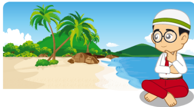
Gambar 7. Kegiatan 4 Pembelajaran BAB 2: Beriman Kepada Allah dan Rasul-Nya Buku PAI Kelas IV Edisi Revisi 2017

Pada kegiatan keempat, perintah yang diinstruksikan kepada peserta didik masih sama dengan kegiatan ketiga, yaitu menceritakan sifat Al-'Adl, mengamati gambar yang tertera dan menceritakan gambar tersebut. Kegiatan ini juga masih berada pada kategori LOTS menurut Taksonomi Anderson.