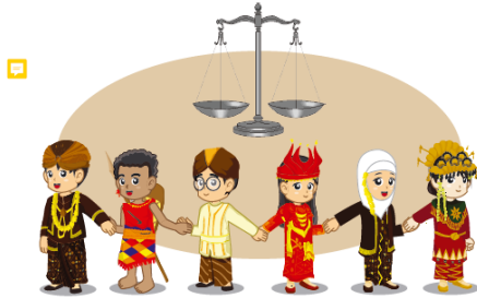
Gambar 6. Kegiatan 3 Pembelajaran BAB 2: Beriman Kepada Allah dan Rasul-Nya Buku PAI Kelas IV Edisi Revisi 2017

Amati dan ceritakan gambar di bawah ini!