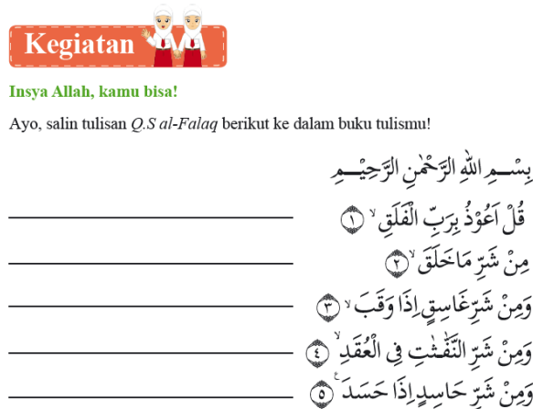
Gambar 3. Kegiatan 3 Pembelajaran BAB 1: Mari Belajar Q.S al-Falaq Buku PAI Kelas IV Edisi Revisi 2017

Pada kegiatan ketiga di bab 1 ini, peserta didik diberikan tugas untuk menuliskan kembali Q.S Al-Falaq. Namun, perlu diperhatikan bahwa kata "menulis" dalam Taksonomi Anderson masih tergolong pada tahap mengingat ( remembering ) dan berada pada kategori Lower Order Thinking Skills (LOTS).