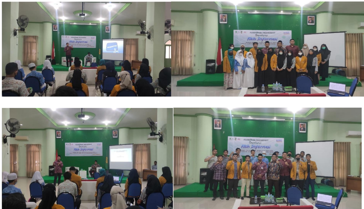
Gambar 1. Kegiatan sosialisasi

Berikut beberapa dokumentasi kegiatan Sosialisasi :