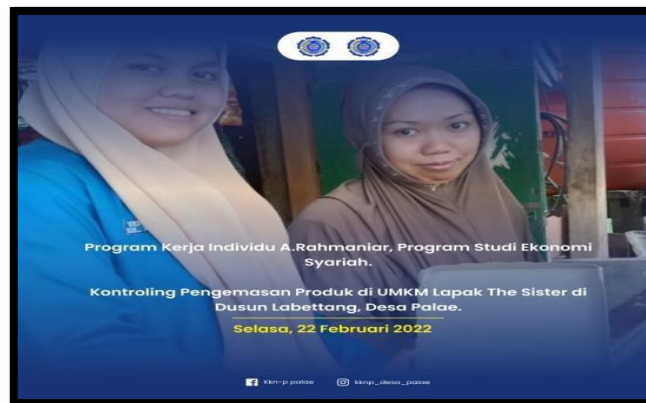
Gambar 6 Kontroling Pengemasan Produk Home Industry Lepak "The Sister"