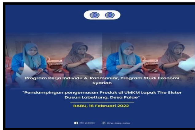
Gambar 5 Kontroling Pengemasan Produk Home Industri Kue Lepak The Sister