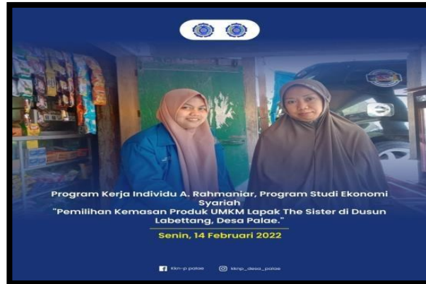
Gambar 3 Pemberian Materi Tentang Kemasan Produk Home Industri Kue Lapak The Sister