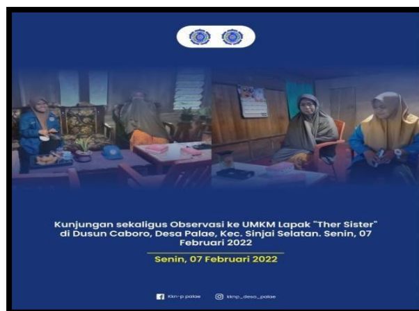
Gambar 1 Kunjungan Sekaligus Observasi Home Industri Kue Lapak The Sister

Pendampingan dilakukan dengan menasihati pemilik stand The Sister untuk mengupdate kemasan produk agar lebih menarik. Selanjutnya, saya akan memberikan contoh paket yang direkomendasikan dan kemudian memeriksa / mengelolanya di stan saudara perempuan saya. Sister menggunakan paket baru untuk meningkatkan tenaga penjualannya.