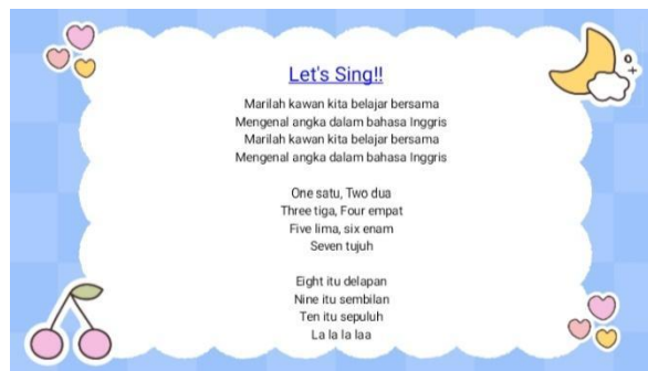
Gambar 2 Teks Nyanyian