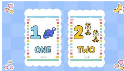
Gambar 1 Media Pembelajaran Power Point

Media pembelajaran yang digunakan dalam kegiatan pembelajaran ini yaitu power point. Menurut penelitian Muharoma & Wulandari, (2014), penggunaan media pembelajaran power point dalam pembelajaran dapat meningkatkan kualitas pembelajaran. Power point yang digunakan dalam praktik mengajar ini dibuat dengan tampilan dan warna yang menarik agar siswa tertarik dalam proses pembelajaran. Terlihat siswa antusias ketika pembelajaran berlangsung. Mereka berebutan maju ke depan kelas untuk menghitung jumlah objek yang ada dalam power point tersebut dalam bahasa Inggris. Suasana waktu itu menjadi riuh dan cukup gaduh. Namun, ketika pembelajaran berlangsung terlihat ada beberapa siswa yang kurang memperhatikan seperti berbincang dengan teman sebangkunya dan berjalan-jalan ke meja lain. Hal tersebut mungkin dikarenakan media pembelajaran yang kurang menarik bagi mereka untuk itu sebaiknya saya perlu mempersiapkan power point yang lebih menarik dengan menambahkan animasi atau suara.