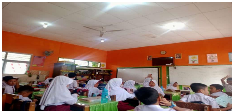
Gambar 3. Siswa sedang melakukan Ice Breaking

Berdasarkan observasi yang dilakukan, informan menegaskan bahwa Ice Breaking adalah strategi untuk mencegah situasi menjadi frustrasi, membosankan, tidak menarik, rileks, atau mengancam sehingga kesempatan belajar dapat meningkat dan menjadi hukuman yang lebih signifikan. Sebagai seorang pengacara, saya juga mendokumentasikan fakta bahwa siswa tersebut sedang melakukan ice breaking .