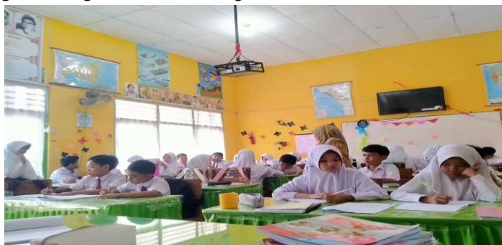
Gambar 5. Anak-anak sedang mendengarkan cerita guru.

Temun diatas menjelaskan peningkatan minat Pembelajaran Pendidikan Kewarganegaraan Menggunakan metode cerita di sekolah dasar. Sebagaimana peneliti juga mendokumentasikan kegiatan siswa sedang mendengarkan cerita dari guru.