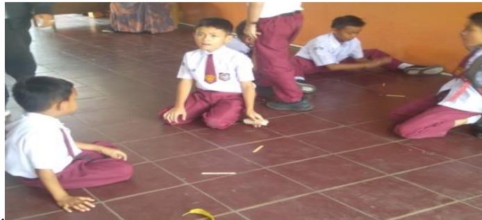
Gambar 2. Siswa sedang bermain Stik Ice Krim

Menurut wawancara peneliti, gagasan bahwa Ice Breaking dapat meningkatkan sikap siswa terhadap pembelajaran karena mereka dapat bermain secara bersamaan disebutkan. Alhasil, setelah pengenalan Ice Breaking, tidak ada lagi siswa yang gugup atau kurang percaya diri saat mengikuti kelas. Seperti yang diamati oleh penonton saat pemain memainkan Stik Ice Breaking, efeknya bagi pemain adalah membuat anak merasa lebih nyaman saat belajar. Sesuai dengan dokumentasi yang diperoleh selama observasi peneliti