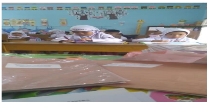
Gambar 4. Siswa sedang mendengarkan nasehat dari guru

Menurut penelitian yang dilakukan informan, penggunaan metode dramatisasi dalam pembelajaran sangat dianjurkan karena dapat membantu siswa mengembangkan akhlak dan kepribadiannya. Sebagai seorang peneliti, Anda juga mendokumentasikan bahwa seorang wanita hendak mempelajari sebuah rahasia dari seorang pria bijak.